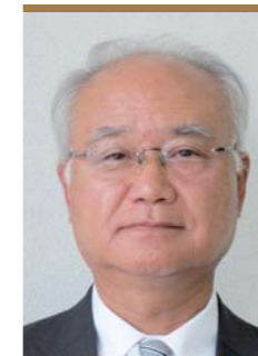
諏訪圏工業メッセ2019 実行委員会 実行委員長 諏訪商工会議所 会頭