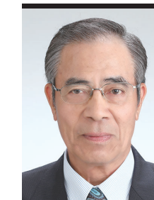
諏訪圏工業メッセ2024 実行委員会 実行委員長 岡谷商工会議所 会頭